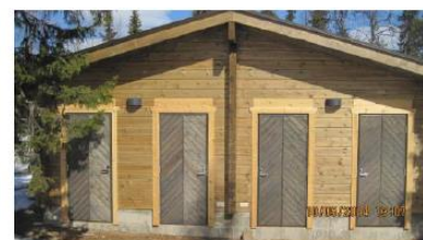
(Huoneisto A kuvan vasemmassa reunassa) (Huoneistoon kuuluu autokatospaikka) (Varastotila kuvan oikeassa reunassa)