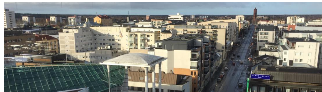
Pori valkea kaupunki aamuauringossa